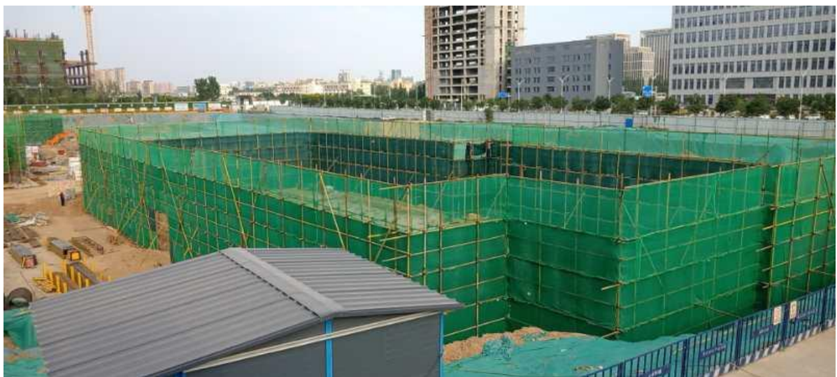
榆次阳光文澜府塔楼基础外架验收